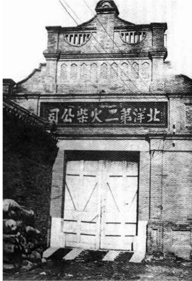
北洋第二火柴公司外景

津“城厢内外创设工学堂（河北工业大学前身），以精其理法；设实习工厂，以练习其技能”。 1