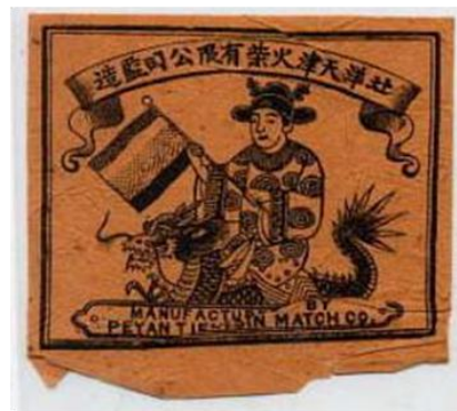
北洋火柴公司状元及第火花

天津的近代火柴工业肇始于 1900 年八国联军入侵天津以前，据汪敬虞《中国近代工业史资料》“历年设立的厂矿名录”载：1900 年以前，天津共有 4 家民族资本开办的近代工业，其中就有 1886 年由吴慰鼎、杨宗镡开办的